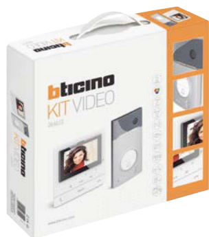
Art. 364613 KIT VIDEO CLASSE100 V16B MONO-FAM. + L2000