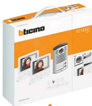
Art. 364231 KIT VIDEO CLASSE100A 16M MONO-FAM. + L3000 HS