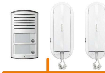
Art. 366821 KIT 2F AUDIO SPRINT L2 - L2000 BIFAM