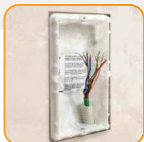
Rimozione posto esterno

Puoi sostituire qualsiasi videocitofono o citofono con un classe 100 connesso in modo semplice. Nessun cablaggio aggiuntivo e in contesti condominiali fino a 22 appartamenti senza aggiungere alimentazioni supplementari!