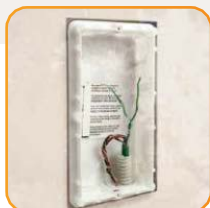
Utilizzo di una coppia cavi per collegare il nuovo posto 2 fili