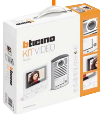
Art. 364622 KIT VIDEO CLASSE100 V16B BI-FAM. + L2000