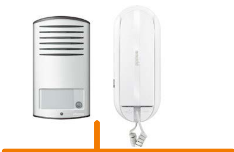
Art. 366811 KIT 2F AUDIO SPRINT L2 - L2000 MONOFAM